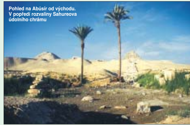
Pohled na Abúsír od východu. V popředí rozvaliny Sahureova údolního chrámu