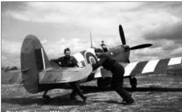
Chichester – červen 1944, po zahájení invaze