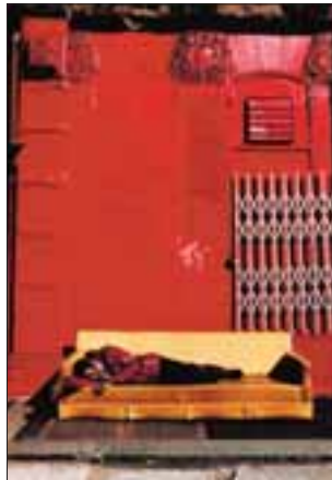
▲ Jan Lukas – Pompeje, 1963

Podobně jako v předchozích letech projekt opět vychází z rozsáhlé fotografické sbírky PPF, jejíž vybranou část vystava prezentuje nejširšímu publiku. „Lukasův cyklus nabízí nejen úvahy o společném základu jedinečných lidských osudů, ale dotýká se i samotné podstaty fotografického média. To přirovnání skutečnost v jistém okamžiku zažehne, aby ji zároveň zmrazilo a uchovalo pro ty, kdo se ještě nenarodili,“ dodává Lagner , který je současně kurátorem fotografické sbírky PPF, patřící k nejvýznamnějším sbírkám současné české fotografie.