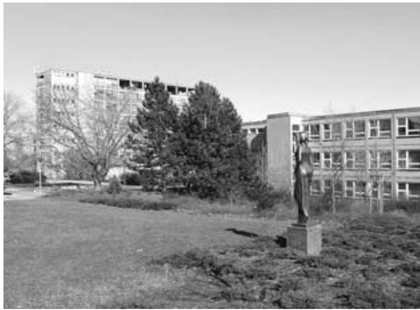
Česká zemědělská univerzita v Praze Suchdole

➤ 16. út. Za památkami starých Bohnic. Pořádáno k 850. výročí obce. Spojeno s prohlídkou kostela sv. Petra a Pavla, farní zahrady a procházkou po okolí. Začátek v 17.00 na konečné stan. aut. č. 102 „Staré Bohnice“ (jede od metra C „Nádraží Holešovice“, „Ládví“, „Kobylisy“). (PhDr. J. Škochová)