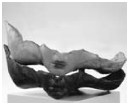
Alina Szapocznikow, Mnohanásobný portrét (dvojnásobný), 1967

Žena s osudem podobným k Evě Kmentové či Evě Hesse, zůstává významnou osobností evropského sochařství. V její tvorbě se snažme číst četná sdělení. Někdy jednoznačná: Exhumovaný ad., jindy ne-přímocárá: Cesta ad. A role názvů? Autorka jimi objekty pojmenovala, ale pozornost přitahuje slovo a obraz v rovnocenném vztahu proti(spolu)hráčů . Snažme-li se její sochy „číst“ dle alegorického vyobrazení, není to dáno jen jazykovým kontextem. Každé dílo znamená mezník a konkrétní stav. Kam sochařka směřovala symboliku? Raná díla velmi korespondují s motivy, na které jsme zvyklí v umění přelomu 19. a 20. století: její Nesnadný věk (1956) je paralelou ke Štursově Pubertě. Rozpoznáme napojení na tradiční symboliku vanitas: Nahá , evokující zobrazení krásného ženského těla, je neidentifikovatelným a deformovaným tvarem. Název – „obraz“ nese napětí v hrozbě pomíjivosti. Od konce padesátých let autorka vzdálením se od tradičního ztvárnění sochy s její stabilitou a vyvážeností naopak rozkladem hmoty dostává nový tvar. Asociace a tzv. domodelování významů, např. Člověk s nástrojem , byly vědomým „rozložením“ tvaru – silnou metaforou. Stěžejní motiv nalezla umělkyně v různých významech lidského těla: časovosti, subjektivnosti a znakovosti. Tělo jako místo, kde se setkává stále Éros i Thanatos – Zrození i Smrt. Tělo jako symbol existence a pomíjivosti, ironie života a osudu.