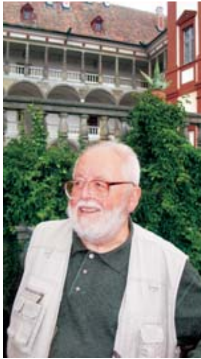
Na nádvoří opočenčenského zámku.

letech nám ale všechno komunisti sebrali a tiskařské stroje rozbili přímo na místě perličky. Naše tiskárna byla v perfektním stavu a nebyla jediná, kterou zničili. Třeba i tiskárnu rodičů zpěváka Karla Kryla, se kterým jsem se dobře znal.