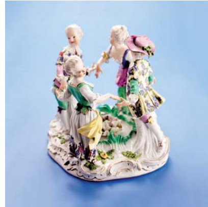
Čtveřice tančících dětí, cca 1760, porcelánová malovaná plastika, model J. J. Käendler, Míšeň, modrá podglazurní značka. © Muzeum hlavního města Prahy

do Clam-Gallasova paláce, Husova 20, Praha 1 ve dnech 15. 11. 2011–22. 1. 2012, otevřeno denně kromě pondělí od 10.00 do 18.00. Výstava zavede návštěvníky do Prahy přibližně let 1741–1791, do období rozkvetu rokokového stylu, ale zároveň i období rozvíjení se osvícenství, racionalismu a nástupu antických reminiscencí v umění. Hraniční data jsou určena nástupem Marie Terezie na trůn a pražskou korunovaci Leopolda II. Základ expozice tvoří předměty každodenního života, nábytek, ošacení, drobné předměty denní potřeby, obrazy, plastiky, grafické listy, knihy a další exponáty ze sbírek a fondů obou pořádajících institucí. Pozoruhodné sbírkové předměty zapůjčily též další pamětové instituce, jako je Uměleckoprůmyslové museum, Národní galerie, Národní muzeum, Strahovská knihovna nebo Archiv Pražského hradu i významné soukromé sbírky.