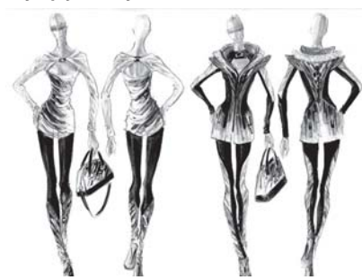
Sportovní kolekce, skica

návrhářka svou vlast obohatit: nově je totiž otevřen také její butik v ulici U Prašné brány (rovněž v prostorách Obecního domu) – pokud tedy zatoužíte třeba po jednom z kousků z její sportovní kolekce nebo některém z doplňků, můžete si ho sem přijít vyzkoušet a případně zakoupit. Pokud vám stačí pouhý pohled na všechno tu módní krásu, přijďte kdykoliv mezi desátou a devatenáctou hodinou na výstavu Timeless do Obecního domu, na náměstí Republiky 5 v Praze 1.