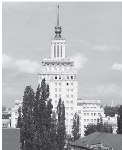
Hotel Crown Plaza (Internacional). (Vycházka – 13. 11.)

Vyšehradský hřbitov. Dušičkové rozjímání nad osudy a životy významných osobností českého národa. Připomeneme si např. kulatá výročí skonu V. Hanky, A. Chittussiho, J. Zeyera, J. Nerudy či J. Kainara. Začátek ve 13.00 před kostelem sv. Petra a Pavla. (A. Škrlandová)