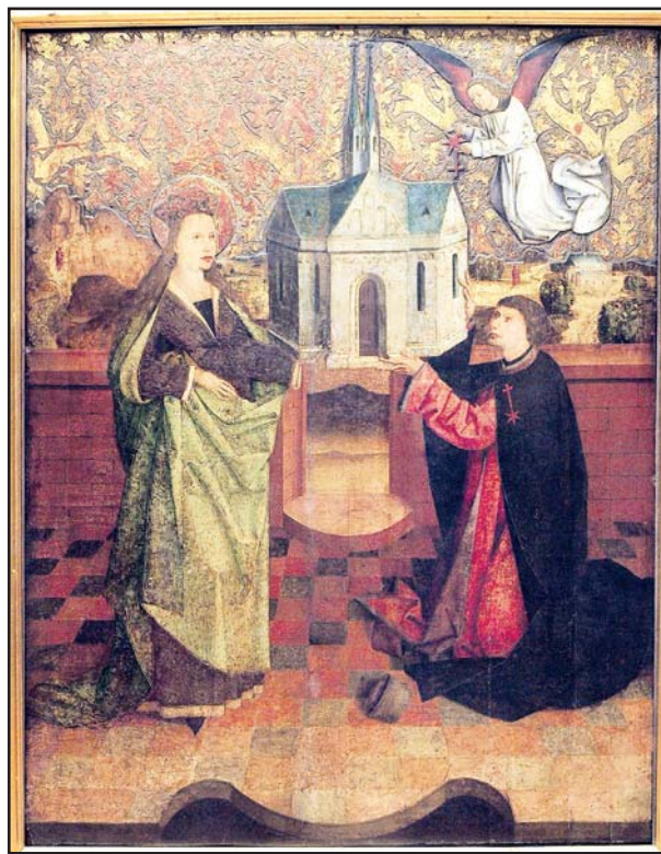
Svatá Anežka předává špitál křižovníckému velmistrovovi

Narozena (snad) 20. ledna 1211 kráľi Přemyslu Otakaru I. a jeho druhé manželce Konstancií Uherské z rodu Arpádovců, byla od tří let se sestrou Annou vychovávána v cisterciáckém klášteře ve slezské Třebnici pod dohledem své tety, vévodkyně Hedviky. V dětském věku se stala předmětem sňatkové politiky otce, který ji několikrát zaslil významným představitelům královských rodin (jejími manželi se měli stát polský vévoda Boleslav, císařův syn Jindřich VII, anglický král Jindřich VIII. Plantagenet či císař Fridrich II.). Ze všech sňatků však z různých důvodů sešlo, posledního nápadníka Anežka odmítla sama a svobodně se rozhodla následovat velkou duchovní výzvu: ideál sv. Františka. Kvůli bohatému naplnění této cesty byla již za svého života nejen ve svém stánku a městě považována za světici. Anežka však ovlivňovala i českou