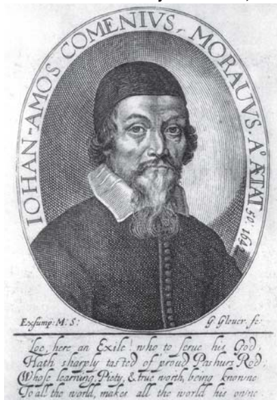
Rytina považovaná za dílo V. Hollara z roku 1652; Muzeum J. A. K. Uherský Brod

Vidina moderní koncepce výchovy a školství pohlíží na 14 let. Pracuje bez oddechu. Jeho převratná učebnicová díla jiskří důvěpím, názornou logikou, stávají se pojmy a didaktika zjevním. Ví se o něm víc, než si myslí, svět si ho žádá. „Koráb vědění“ vydává se na cestu mnoha městy, zakotví v Anglii (1641) a nadlouho ve Švédsku (1642). Ale jsou to jen přístavy naděje a zklamání. Píše