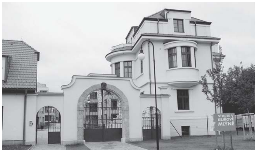
Kejřův mlýn (Vycházka 18. 3. – Z Hloubětína do Hrdlořez)

■ 11. ne. Na co se těší židovské děti? Vycházka pro děti do synagogy Klausové a Španělské poutavou formou přiblíží život jejich židovských vrstevníků. Sraz v 10.00 před Klausovou synagogou, U Starého hřbitova, P 1. Cena 100/70 Kč + do objektu 75 Kč. (Z. Pavlovská, M. Kobliňová) Švandovo divadlo. Seznámíme se s historií divadla, projdeme se po jevišti, navštívíme herecké šatny, maskérnu či kulisu. Za-