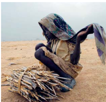
J. Matthews, Afganistán (© CARE)

Každou chvíli jsme konfrontováni s následky nebyvalých živelných katastrof, ale i postupných dlouhodobých změn klimatu,