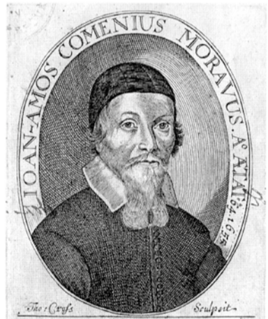
Komenský 1656 Thomas Cross

Pro prezentaci oslav byl vytvořen jednotný vizuální styl. Na multimediální spot