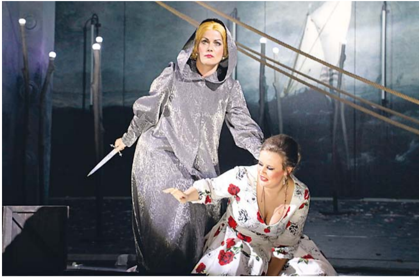
La Gioconda

Čtrnáctý ročník Festivalu hudebního divadla Opera 2020 trvá až do začátku března. Kromě dramaturgicky pestré nabídky představení tuzemských městských souborů nabízí i alternativní operní zážitky, mj. aktuální operní novinky.