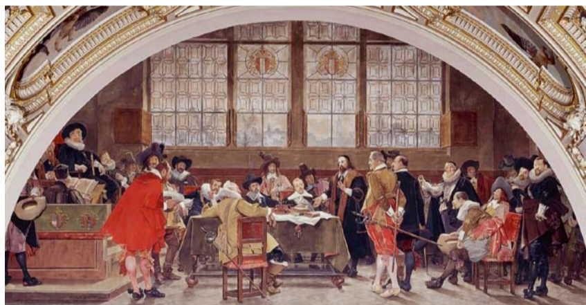
Luneta, Jan Amos Komenský v pantheonu Národního muzea od Václava Brožíka