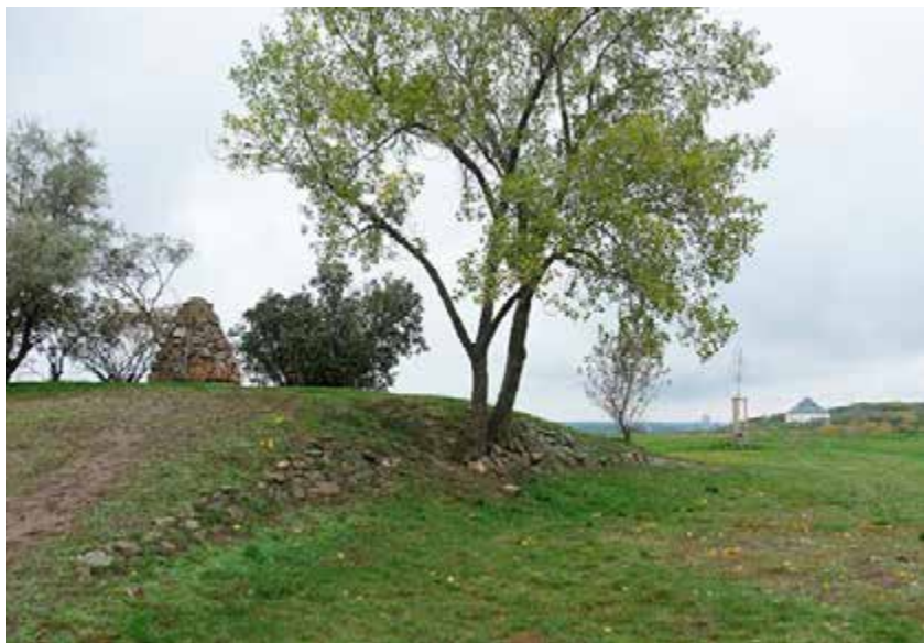
Mohyla na Bílé hoře, v pozadí letohrádek Hvězda

Že jim nic jiného nezbylo, protože nečekane uvízli v obklíčení, již staré pověsti české raději nekomentují. Hrdinů máme poskrovnu, tak si je někdy musíme vyrábět i uměle.