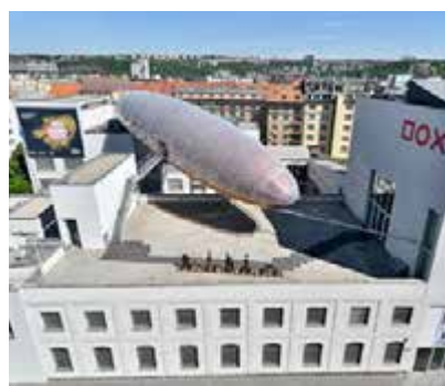
DOX vzducholoď