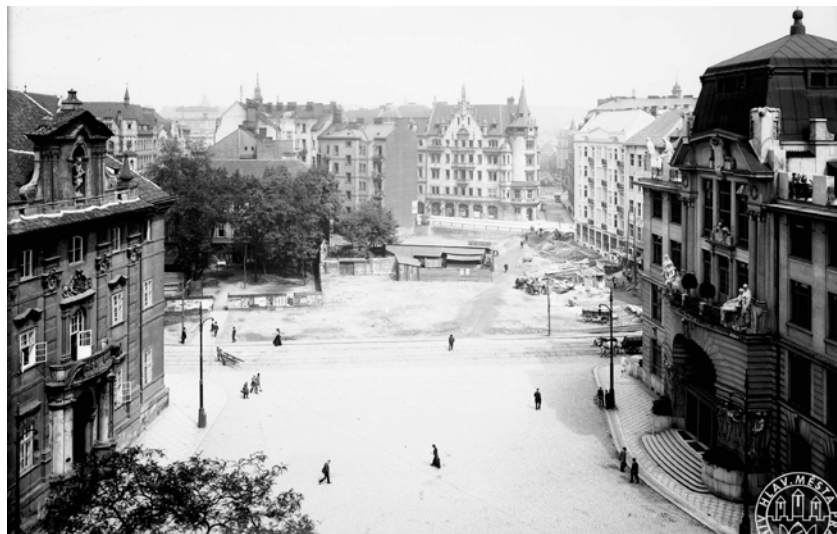
Pohled ze střechy Clam-Gallasova paláce na Mariánské náměstí. Vlevo Klementinum, vpravo budova Magistrátu. V pozadí uprostřed prostranství po vybourání původních domů Platněské ulice a za nimi novostavby v Kaprově a v Žatecké ulici.

A tak nadšení diváci mohli na výstavě vidět Kříženeckým natočené záběry z pražských ulic i z výstaviště. Vznikly první české aktuality – Purkyňovo náměstí, Polední výstřel z děla na Baště sv. Tomáše, Svatojanská pouť, Výjezd parní stříkačky k ohni . A Kříženecký natáčel dále: české památky nebo český lid na různých slavnostech. Nebo, inspirovaný francouzským vzorem, vznikly i kratičké filmy se sportovní tematikou, například Cyklisté, Cvičení s kužely