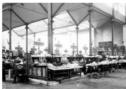
Pohled do interiéru Staroměstské tržnice (domu čp. 406 na Starém Městě) v Rytiřské ulici. 16. 12. 1910.

A tak nadšení diváci mohli na výstavě vidět Kříženeckým natočené záběry z pražských ulic i z výstaviště. Vznikly první české aktuality – Purkyňovo náměstí, Polední výstřel z děla na Baště sv. Tomáše, Svatojanská pouť, Výjezd parní stříkačky k ohni . A Kříženecký natáčel dále: české památky nebo český lid na různých slavnostech. Nebo, inspirovaný francouzským vzorem, vznikly i kratičké filmy se sportovní tematikou, například Cyklisté, Cvičení s kužely