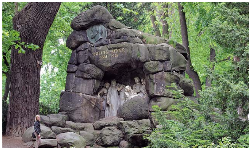
Pomník Julia Zeyera (přednáška 1. 2.)