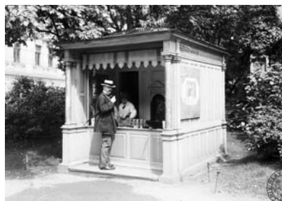
Pohled na stánek s občerstvením na Karlově náměstí.