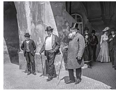
Rudolf Bruner-Dvořák, Procházkou po Staroměstském náměstí (Alfons Mucha, Auguste Rodin), 1902, tisk z dobového pozitivu, Sběrka Scheuffler, Praha

Příjezd Augusta Rodina byl významný pro tehdejší generaci malířů a zejména sochařů, kterým pomohl ujasnit cestu k modernímu výtvarnému směřování, ale také předznamenat budoucí orientaci výtvarné scény k francouzskému umění. Příležitost k Rodinově cestě, ač prý cestoval nerad,