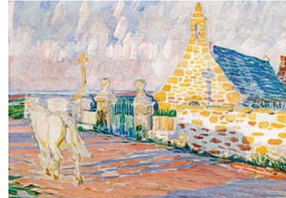
František Kupka, Bílý kůň

Obdivovatele českého výtvarného umění jistě potěší mistrovská díla takových malířů jako jsou Václav Brožík, Emil Filla, Josef Čapek, Antonín Chittussi, Mikuláš Medek, Vác-