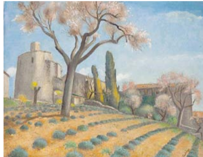
Othon Coubine, Rotunda , kolem 1936, Národní galerie v Praze

ve Francii tvořící jako Oton Coubine. I on se rád věnoval figurativní malbě, často portrétům švadlenek či krajčářek, a stále častěji i francouzské krajině. Z kosmopolitní Paříže tak spočineme v poklidných krajinách s olivovníky a cypřiši, jejichž vůně, modravě