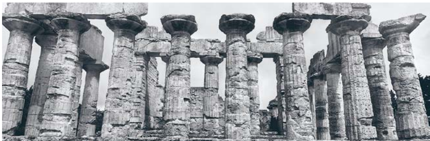
Libye, Cyrene, 2009

Josef Koudelka se za nimi vypravil na desítky míst od Albánie, přes Bulharsko, Chorvatsko, Itálii, Francii, Maroko až do Libye, na Kypr, do Egypta, Izraele, Libanonu, Jordánska a dalších zemí oblasti Středomoří, kde antické stavby vznikaly ponejvíce.