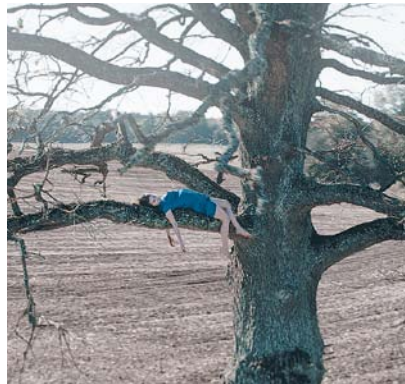
Z úvodního snímku přehlídky Nesmírný.

Letos se diváci mohou těšit na filmy z Dánska, Švédska, Norska, Finska a Islandu. Na program budou: Hammarskjöld – Boj za mír / Nesmírný / Spermageddon / Chlad / Věčný / Quisling – poslední dny / Raketa / Tenkrát v lese / Tundra ve mně / Armand / Hra o moc – Musí to být žena (epizoda 1) / Hra o moc – Další čtyři roky (epizoda 2)