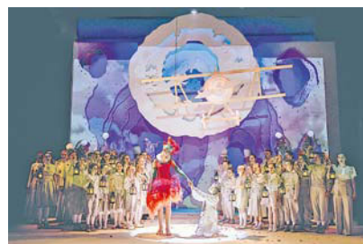
Malý princ

9. Věčná milienka Alma Mahlerová 10. Poslední sezení u doktora Freuda 15.00 11. Eleanor 12. Improvizční řez 13. A tak tě prosím, kniže 14. Váňa veřejná generálka 11.00 15. Váňa premiéra 16. Váňa 17. Hravé čtení – Malý princ 11.00 17. S prezidentem v divočině 18. Odvolání 21. Jeden německý život 22. Bez zábran host 23. Hloupe malíčkovosti host 25. HAF 11.00 25. Váňa 27. Falešná nota 28. Věčná milienka Alma Mahlerová 29. Relativita 30. Eleanor 31. Bláznec Začátky představení v 19.30, není-li uvedeno jinak.