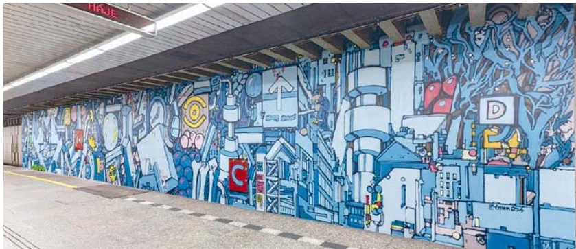
Murál Michala Škapy ve stanici Florenc

Stanice Florenc na lince C pomalovali umělci Michal Škapa, který ve směru jízdy na Háje vytvořil velkoformátovou malbu laděnou do modré barvy. Vyobrazuje na ní motivy metra a stylem připomíná spíše graffiti. Naproti němu, ve směru jízdy do Letňan, se stěny zhostil Matěj Olmer, který pokryl ještě větší plochu a vytvořil dílo do stylu abstraktní malby laděné do odstínů modré a žluté.