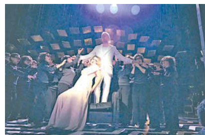
Král Roger

K vidění tam budou velmi rozmanité projekty – autorská díla mladých skladatelů, experimentální skladby, díla nalezená v archívech, ale také třeba Dráteník , první opera napsaná na české libreto, nebo komorní verze Prodané nevěsty .