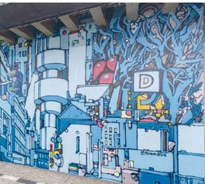
Murál Michala Škapy ve stanici Florenc

Tyto projekty budou zdobit metro několik měsíců a cestujícím tak zpestří každodenní