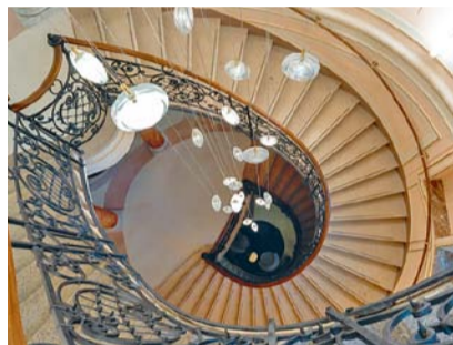
Náměstí Republiky čp. 7

Festival doplní i bohatý program komentovaných prohlídek, debat a procházek. V rámci Prahy 1 se může návštěvník vypravit do technického zázemí Národní