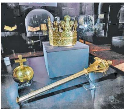
Pohřební klenoty Přemysla II. Otakara

A nutno říct, že pohled na vystavené exponáty vzbuzuje úctu – nejen před našimi předky, před jejich schopnostmi, poznáním či uměním, ale i před historiky a restaurátory, kteří tyto skvosty dokázali ochránit a zachovat pro dnešní generace. Příkladem až citového působení na návštěvníka může být dochovaný a restaurovaný hedvábný obleček pro kojence, předčasně zemřelého potomka z panovnického dvora v polovině 13. století. Stejně tak užasne nad nejstarším záznamem písně Hospodine pomiluj ny, jejímž autorem by mohl být sv. Vojtěch, nebo nad rouchem z hrobu sv. Ludmily, manželky knížete Bořivoje, babičky sv. Václava, zavražděné v 10. století. Je tu i tzv. svatováclavská přilba (v tomto případě kopie) – jeden z nejzajímavějších symbolů české státnosti i svatováclavského kultu.