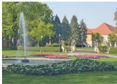
Královská zahrada

Víkend otevřených zahrad letos 13. až 14. června je jedinečnou příležitostí nahlédnout (samozřejmě mimo jiných zahrad) do Královské zahrady Pražského hradu včetně Oranžerie a do zámeckého parku Lány. Během tohoto víkendu se zde můžete těšit na komentované prohlídky s možností poznat historické i současné zahradní umění.