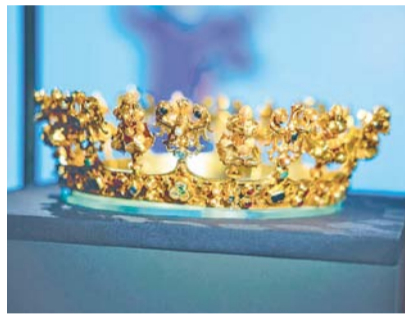
Královská koruna ze Slezské Středy

Dále jsou prezentovány i archeologické nálezy z přemyslovských hradů, které za-