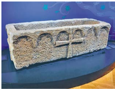
Sarkofág sv. Longina

zvaného král železný a zlatý. Dokumenty a vystavené předměty dokládají nejen obchodní styk českých zemí s celou Evropou, ale i přejímání uměleckých vzorů. V době vlády Václava II. expanze dosáhla vrcholu připojením části dnešního Polska, Slezska a sňatkem syna Václava III. i získáním Uher. Tento rozsah moci se však nepodařilo dlouho udržet kvůli předčasné smrti Václava II. a následně zavraždění Václava III. v Olomouci ve věku necelých 17 let. Jeho vražda nebyla nikdy objasněna a končí jí pět století panování Přemyslovců v českých a moravských zemích.