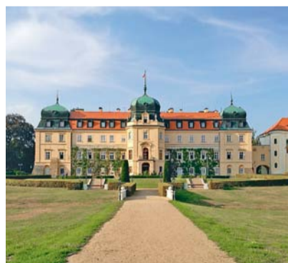
Zámek Lány